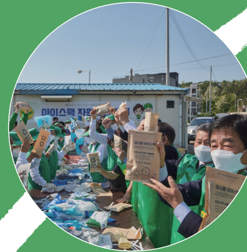
02 자원재활용의 활성화로 '순환경제' 실천·홍보