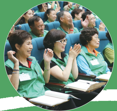
03 새마을연수원 전문성 확보·기능 고도화