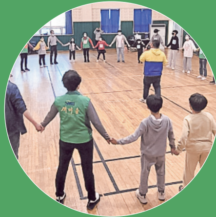
01 새마을회원 확충 회원단체 간 연대·협력 강화

지역의 인재들과 연대·협력을 통해 시대가 처한 기후위기와 지역의 문제를 함께 고민하고, 창의적이고 혁신적인 주체로 지속가능한 새마을운동의 추진 동력을 마련해 새마을운동의 새로운 방향, 새로운 미래가치를 실현합니다.