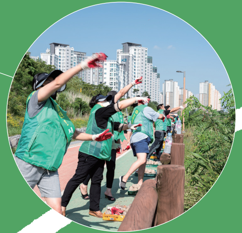
03 산림, 해양, 토양 등 자연·생태 보호·관리