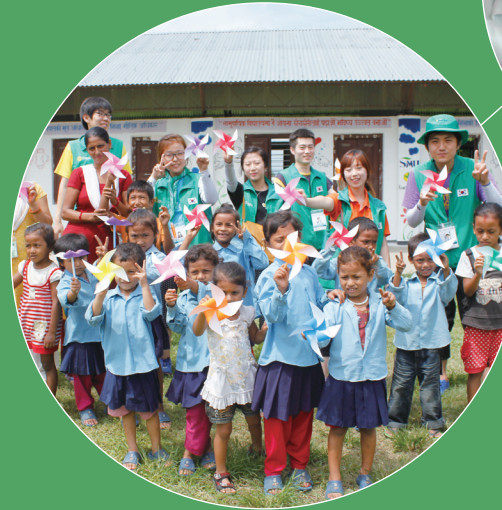
02 청년층 참여 확대 해외 봉사단 운영