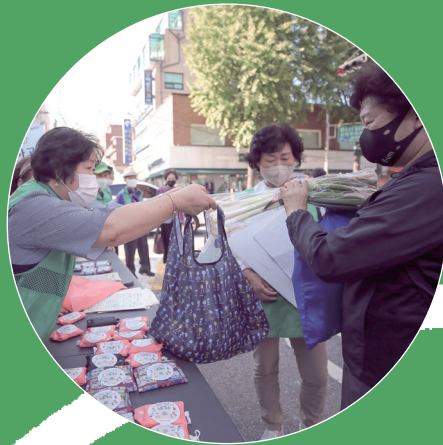
01 친환경생활 실천 정착

새마을운동은 탄소중립 실천을 통해 지속가능한 지구, 지속가능한 공동체를 만들어가고 있습니다.